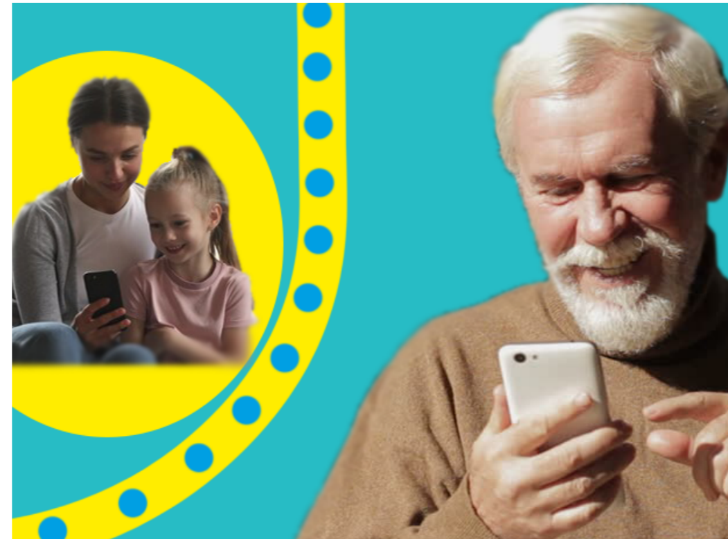
Modalità d'uso Mode of use