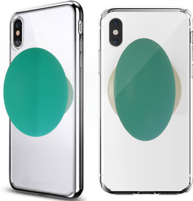
Il dispositivo The device