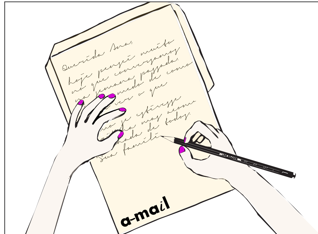
Escreva sua carta / Write your letter

Design for Emergency Semeando ideias / Seed ideas